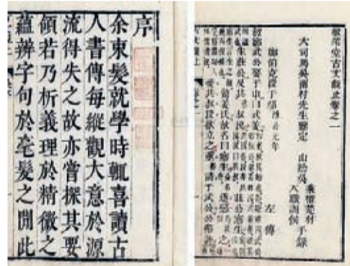
▲《古文觀止》清刻本書影（資料圖片）