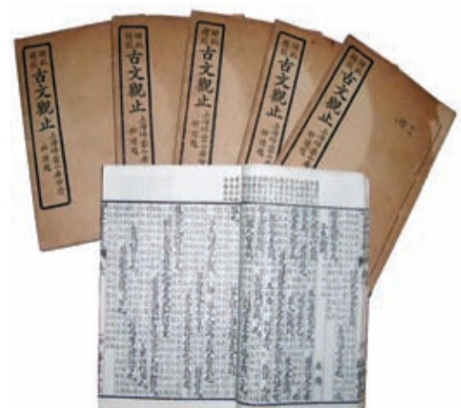
▲ 1934 年出版的綫裝《古文觀止》