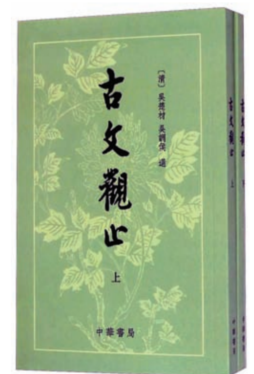
▲《古文觀止》封面（中華書局版）